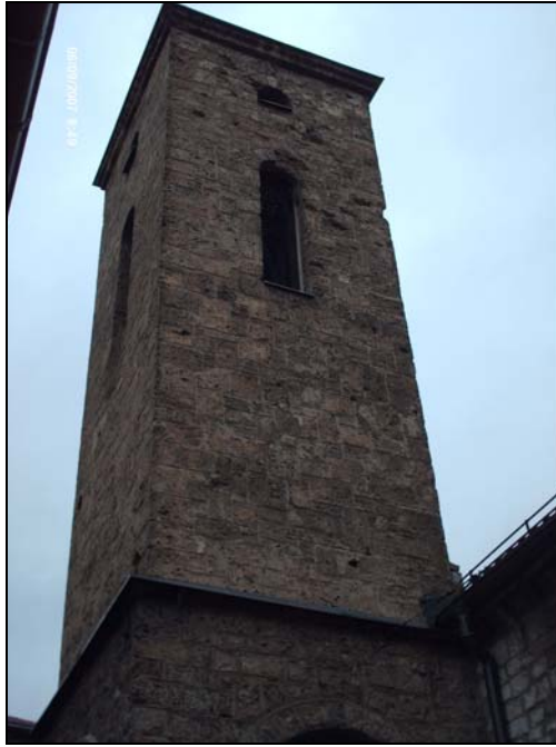
Particolare della chiesa ortodossa di Sarajevo