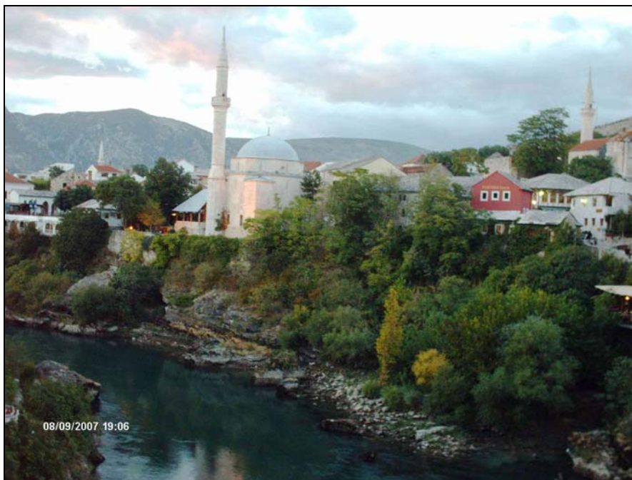
La splendida Mostar