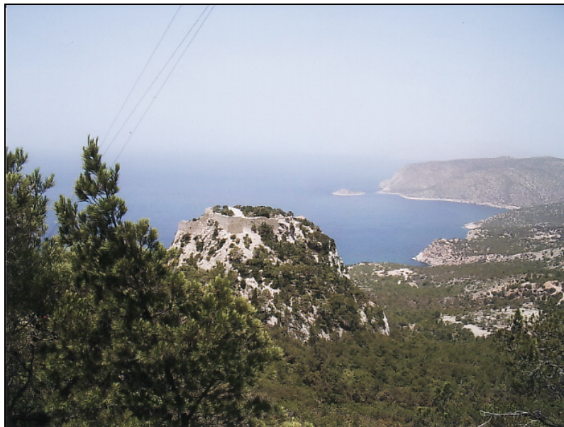
Rodi - Panorama

Nel VII° secolo resiste agli assedi arabi e persiani, perde soltanto l'Egitto e si caratterizza per il carattere autonomistico della chiesa ortodossa nei confronti di Roma. Il culmine di tale scontro teologico - filosofico avviene nel 1054 in occasione del celebre scisma d'Oriente. La pesante imposizione fiscale e la severa amministrazione statale provocano la creazione di province semiautonome che alla fine dell'XI° secolo diventano un terreno molto fertile per l'egemonia franca e veneziana. Lo scandaloso sacco di Costantinopoli condotto dai crociati nel 1204 segna il declino inesorabile dell'Impero bizantino che formalmente cade nel 1453 quando Bisanzio viene occupata dai turchi ottomani e ribattezzata Istanbul.