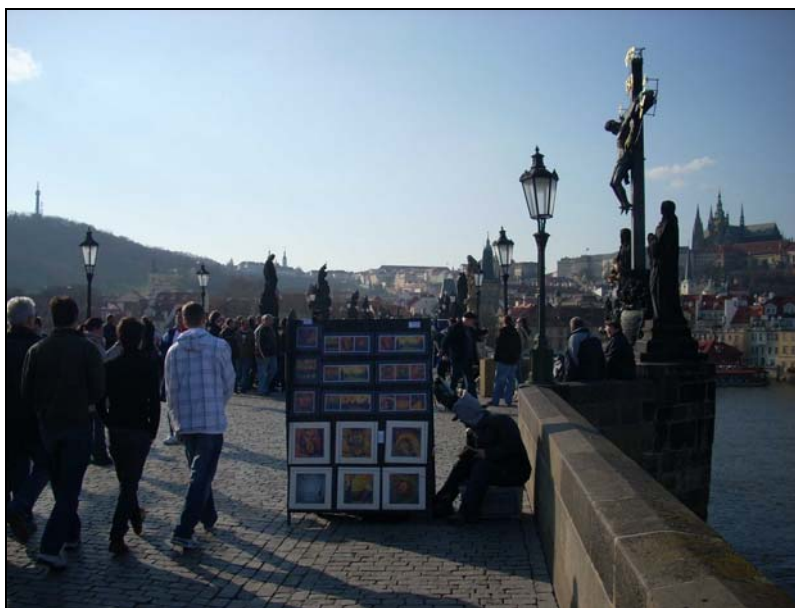
Lungo il Ponte Carlo

consensuale ed indolore tra Repubblica Ceca e Slovacchia: la prima fa parte dell'Unione Europea dal 2004 e la seconda probabilmente non tarderà a farne parte in futuro.